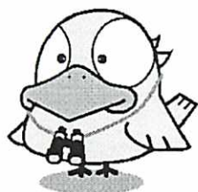
薬害オンブズパースンマスコット「カナリアン」

薬害イレッサ訴訟では、国、企業の責任を認めた判決が下されており、早期の全面解決が求められます。また、抗がん剤での副作用被害救済制度の創設など、がん患者が安心して医療を受ける体制づくりが求められます。薬害の連鎖を断ち切るために、薬害肝炎の検証会議で提言された医薬品行政を監視する第三者機関の実現が必要不可欠です。